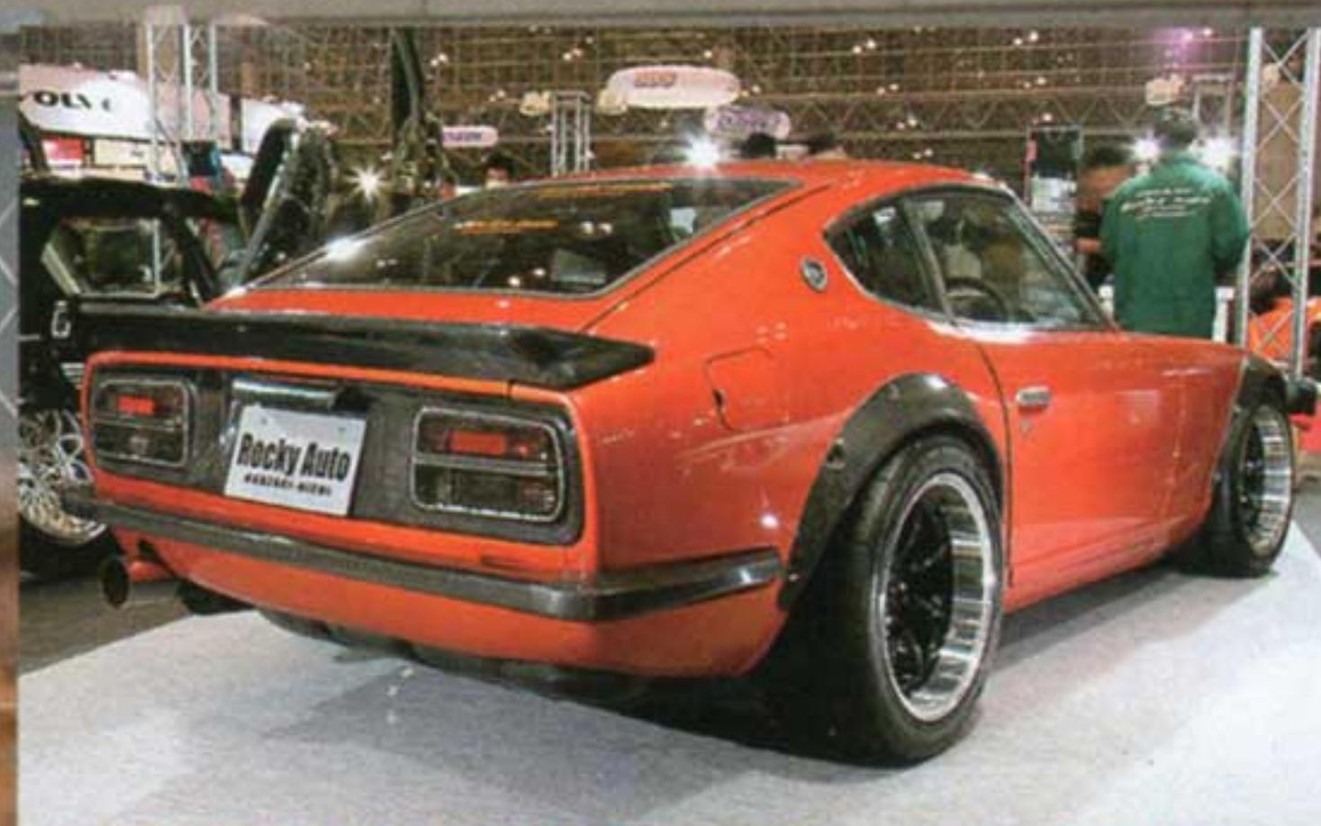
金属製の純正の燃料タンクからサビの心配がない樹脂製の燃料タンク（Z33純正ではない）に変えられている。こまめに快適に乗れるS30Zは今までのクルマと違う。

〒466-0201 愛知県岡崎市小美町字殿街道153 ☎0564-66-5488 http://www.rockyauto.co.jp