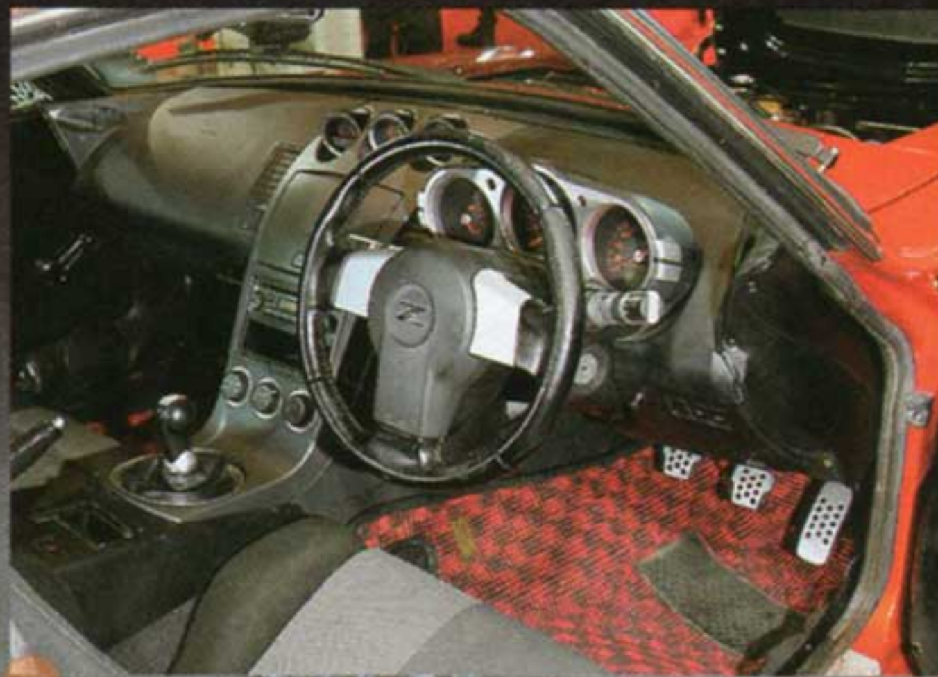
Z33のダッシュボードやメーター類がS30Zに移植できるということを誰が想像しただろうか？ CANやエアコンまでZ33で見事に動き、旧車の快適性を増している。