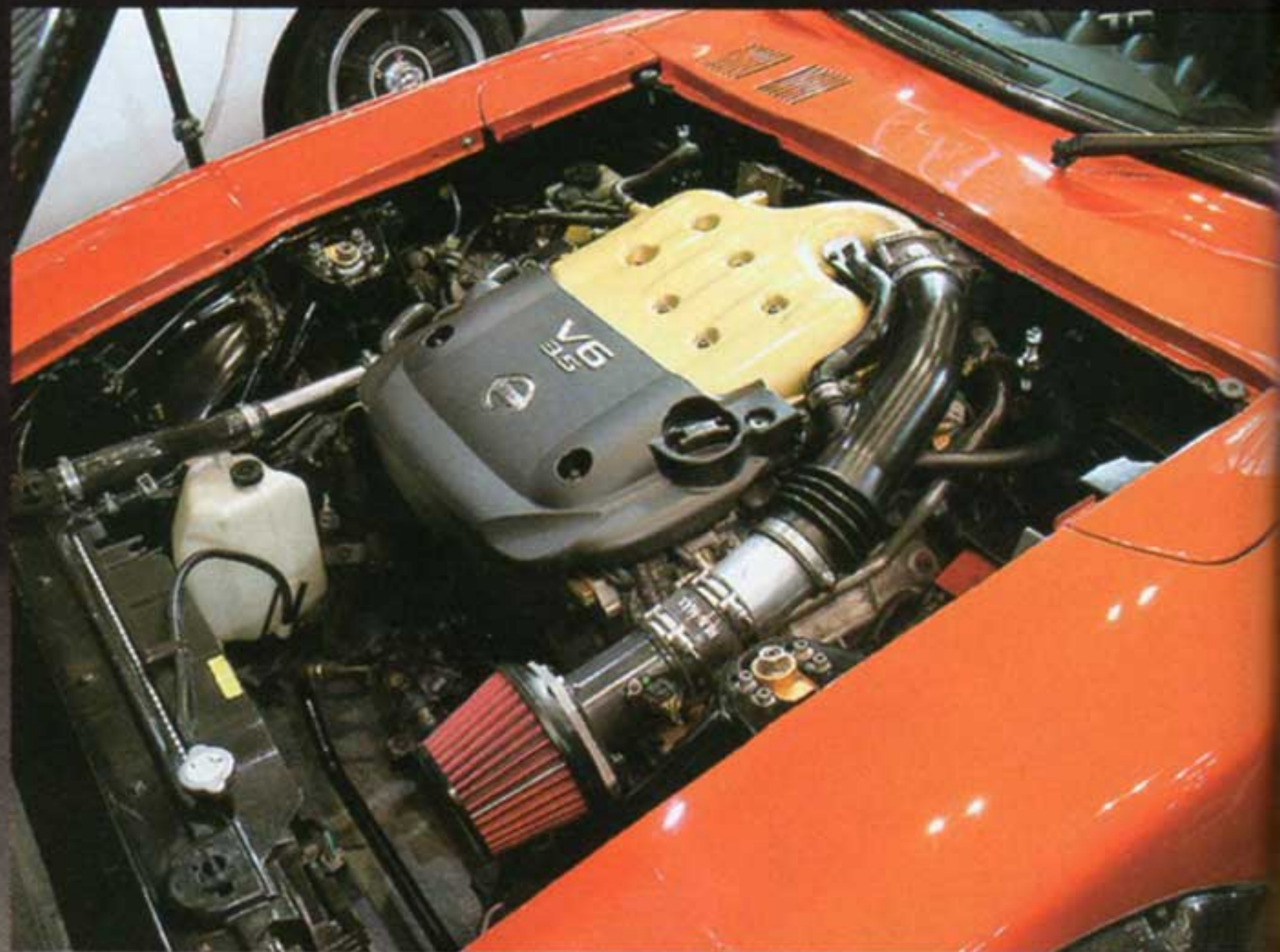
ストラットまで取まるコンパクトなVQ35DE。オーバーハングの重量物が少ないため、挙動も安定しているという。